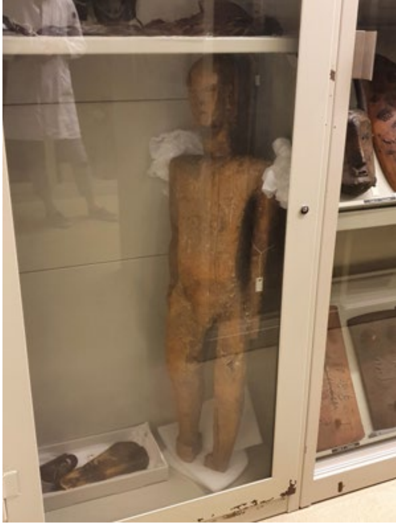
Kigiilya in het depot van het Etnologisch Museum in Berlijn

Gehuld in witte stofjassen, blauwe handschoenen en met een groot wit luchtmasker op brengen Schimanowski en Weber-Sinn ons met de lift naar beneden. We lopen een grote stalen deur door, komen in een donkere gang, moeten nog een stalen deur door en ineens, meteen bij binnenkomst, zien we hem. Daar ligt-ie: het houten beeld, Kigiilya, op een groot wit kussen op een soort brancard met daarover een wit laken, alsof hij is opgebaard.