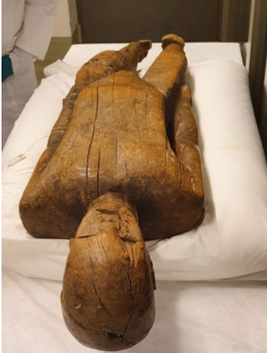
Kigiilya in het depot van het Etnologisch Museum in Berlijn