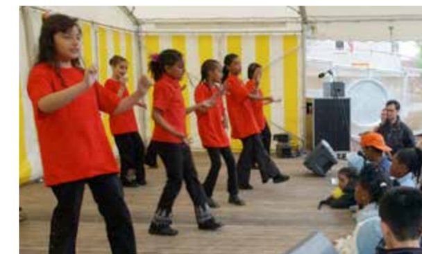
De dansgroep was zo goed, dat ze ook optrad bij allerlei evenementen buiten het azc.

Toen de kerken van Heemskerk hoorden dat er een asielzoekerscentrum zou komen in hun gemeente, wilden ze voor de asielzoekers iets doen om zich thuis te laten voelen in de Heemskerkse samenleving. Ze richtten Heemskerk-Gastvrij op. Maar liefst veertig vrijwilligers meldden zich om activiteiten te organiseren voor de vluchtelingen. In het begin ging dat nog aarzelen, afstastend, vertelt Reinier van Tellingen, een van de oprichters van Heemskerk-Gastvrij. Uiteindelijk ontstond een groep vrijwilligers waarin ook bewoners van het azc actief waren. Met zijn allen zorgden ze