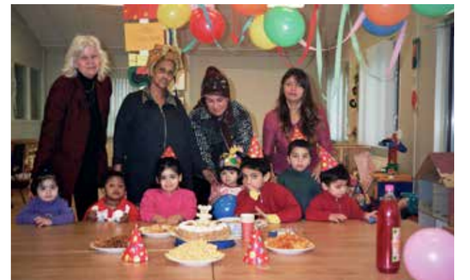
Ook verjaardagen werden gevierd in het AZC.