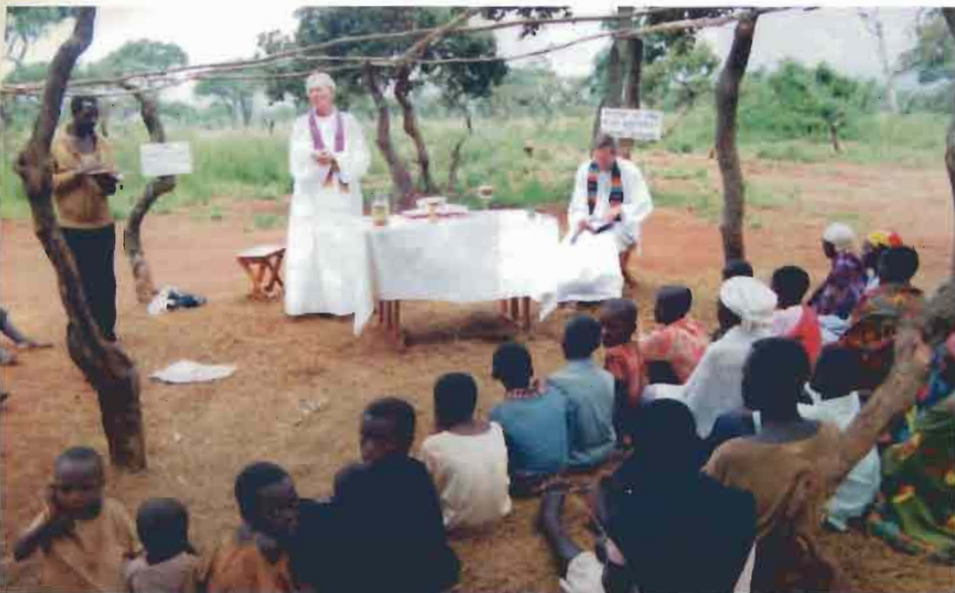
Mis in de open lucht, Burundees vluchtelingen-kamp in Tanzania, (1994)