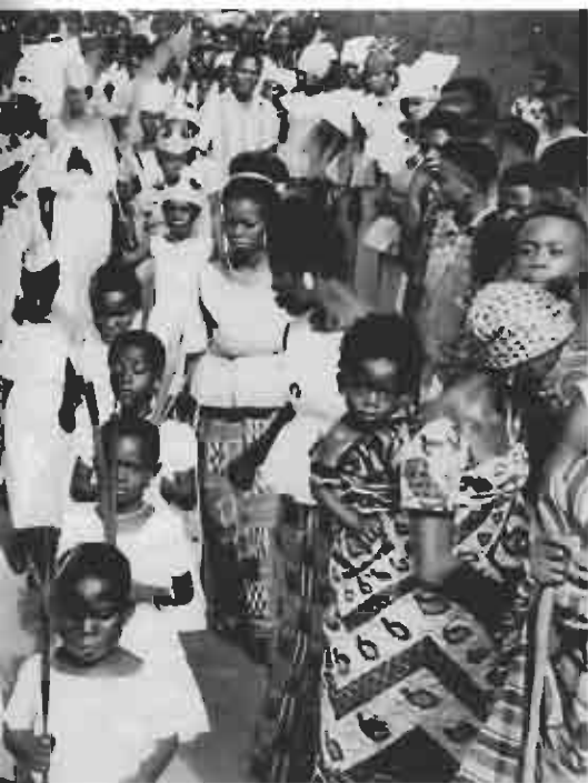
Sacraments- processie in Ghana (1970)