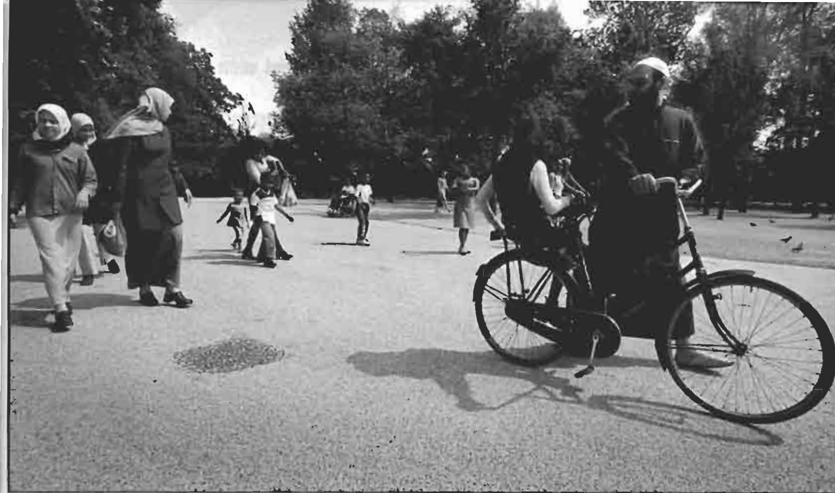
Een half jaar geleden werd het Oosterpark als locatie voor het monument gekozen.

inzake de herinnering aan het slavernijverleden. Dat comité van aanbeveling vroeg 26 meer en minder bekende zwarte en witte Nederlanders als ambassadeur voor het monument op te treden om zo het draagvlak ervoor te kunnen vergroten.